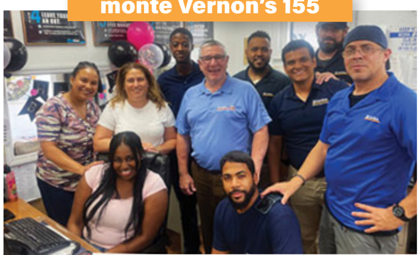
monte Vernon's 155