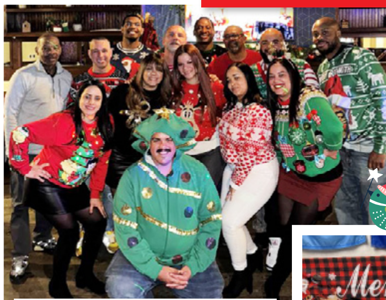
401 Mt. Vernon