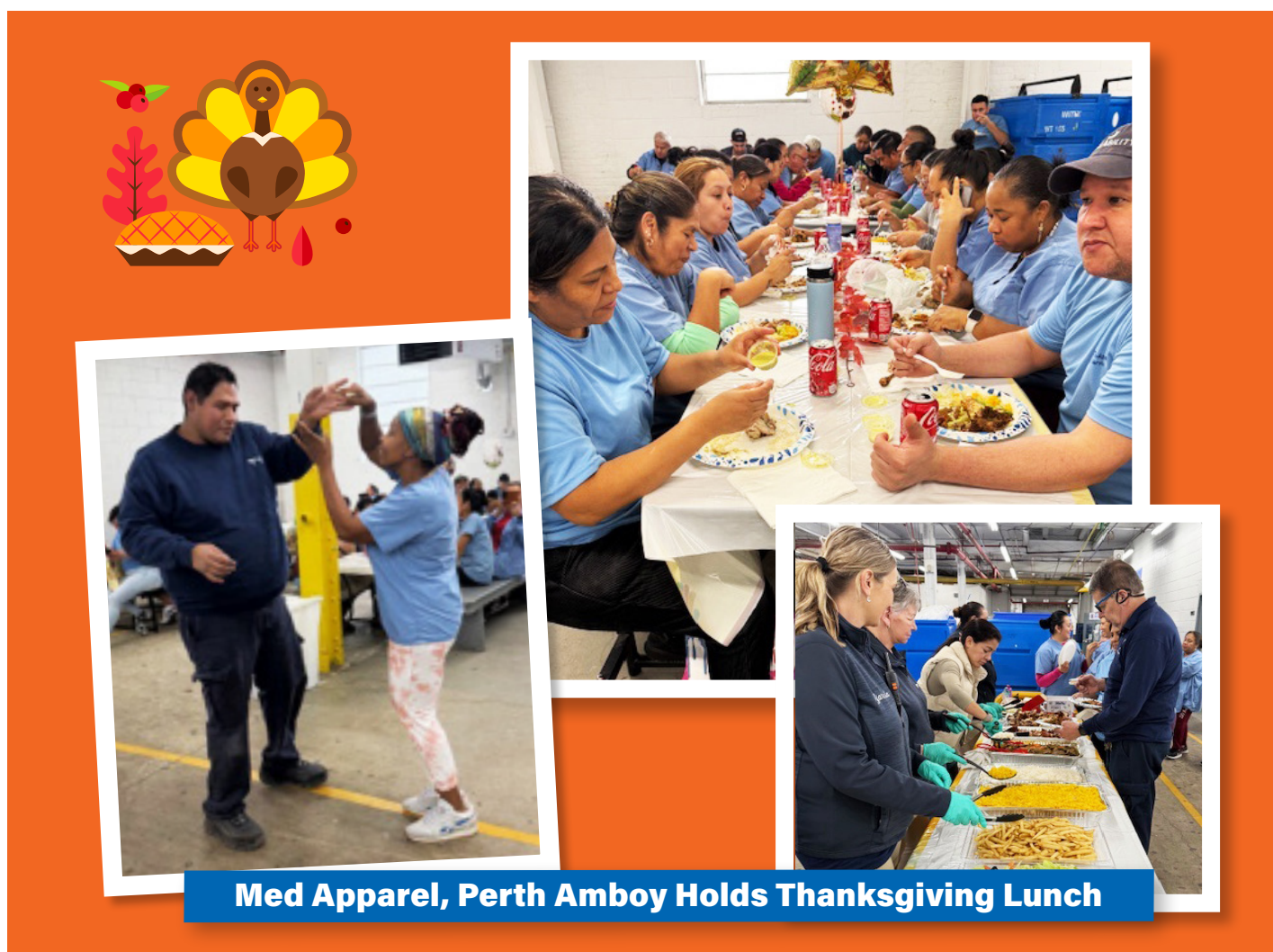
Med Apparel, Perth Amboy Holds Thanksgiving Lunch