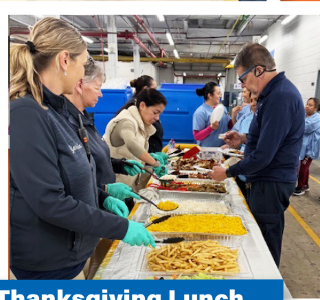
Med Apparel, Perth Amboy Holds Thanksgiving Lunch