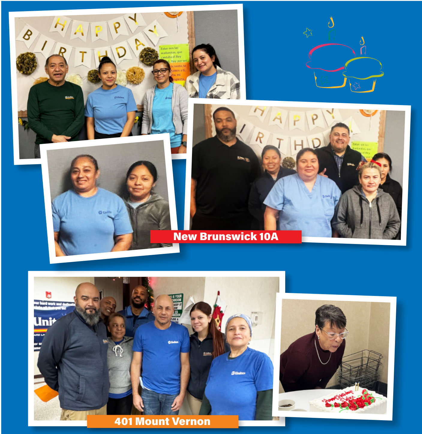
New Brunswick 10A